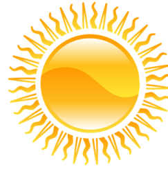
il fait beau il y a du soleil