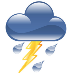
il y a de l'orage