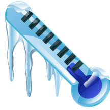
il fait froid