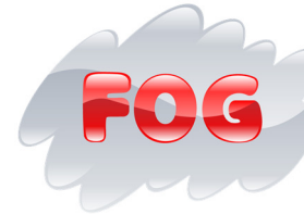
il y a du brouillard