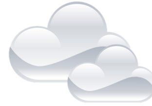
il fait gris il fait mauvais